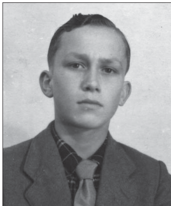
Dit ben ik tijdens mijn mulotijd, omstreeks 1953.

Het echte molenaarsvak kwam na de oorlog steeds meer in de verdrukking, zoals eerder al gezegd. Vooral het malen liep zienderogen terug. Nadat ik mijn vrachtwagenrijbewijs had gehaald, reed ik vaak met onze Bedford om graan, mengvoeders, mineralen, slakkenmeel, stikstof en kalomon salpeter, zaten toen in zakken van 100 kilo en kunstmest te halen bij de grote fabrikanten. Vanaf de zestiger jaren was UTD (Ulbe Twijnstra Delfia) mengvoeders onze belangrijkste leverancier.