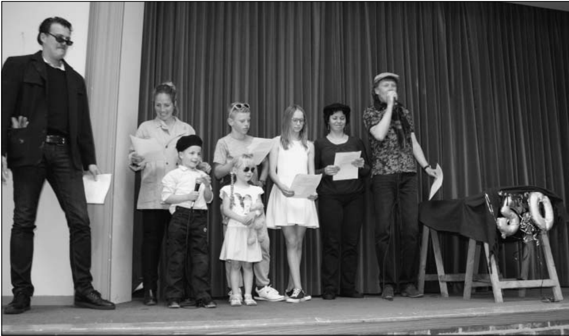
Kinderen en kleinkinderen bij ons gouden huwelijksfeest op 20 mei 2017.

die minder goed ter been zijn naar diverse afspraken. Een werk, dat me heel veel voldoening geeft.