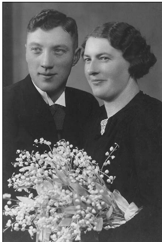
Trouwdag van mijn ouders op 17 januari 1940.