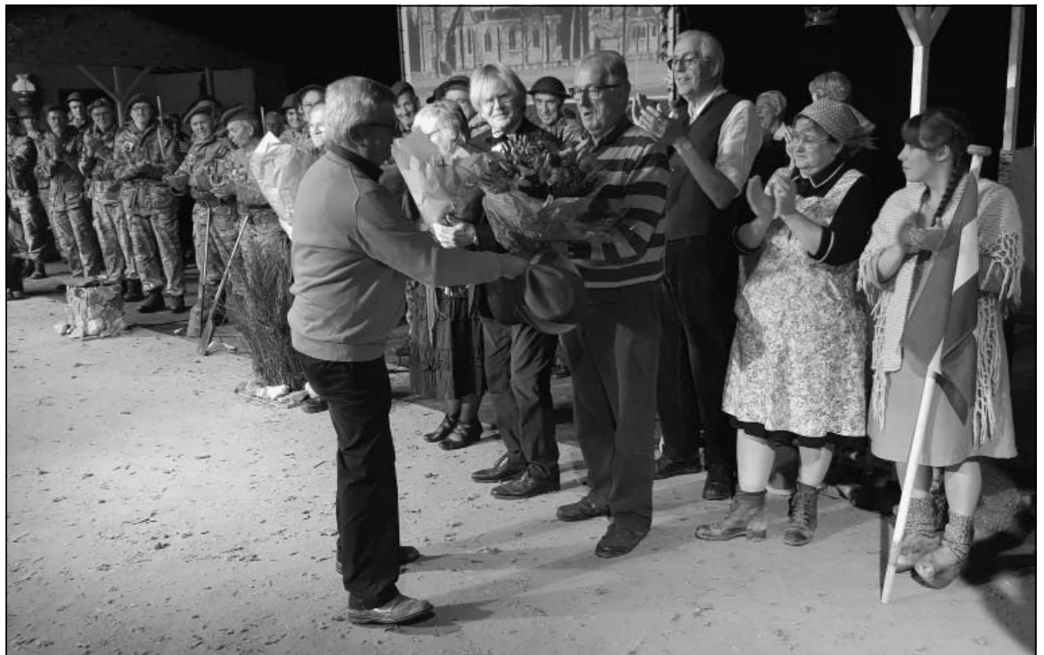
Voor mijn bijdrage aan de oorlogsrevue, 'En we duiken nie mèr onder', werd ik in de bloemetjes gezet. Manege 'de Meulenhoai', oktober 2019.

In 2000 zijn we verhuisd naar België en wonen we in Mol. Het huis aan de Mierdseweg met het magazijn was te groot geworden en daarom zochten we iets anders. We wonen in een fijne buurt en hebben het goed naar onze zin. In 2014 heb ik me aangemeld in Mol als vrijwilliger bij de Minder Mobielen Centrale. Wij rijden mensen