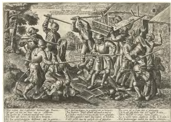
Strijd tussen boeren en soldaten (prentmaker: Peeter Baltens naar ontwerp van: Pieter Bruegel).

Rechterlijk Archief Bladel inv 41 folio 111 – 112