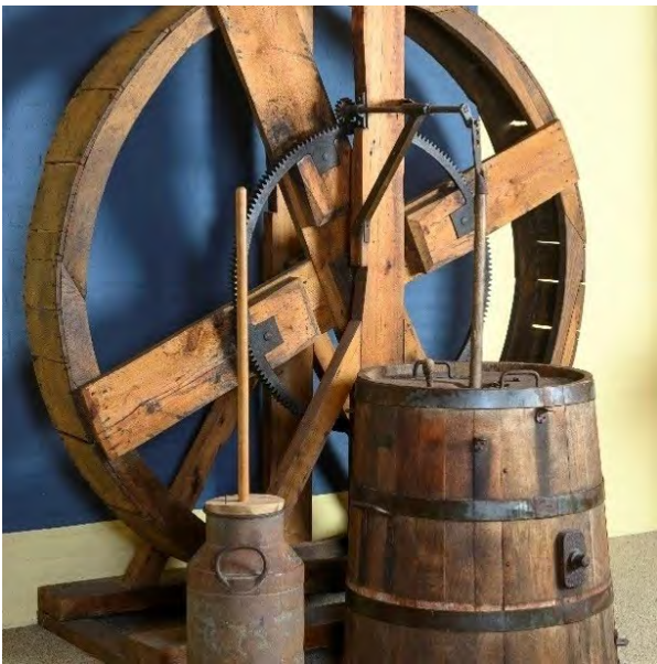
Gemak bij het karnen/Meer boter in minder tijd

Om boter en karnemelk te bereiden stond een boerin vroeger urenlang een stamper in een ton met melk in beweging te houden. Vanaf eind 18e eeuw werd in Brabant dit saai, eentonige en tijdrovende werk makkelijker gemaakt met behulp van de hondenkarn. Door een hond in een tredmolen te laten lopen werd via een mechanisme van tandwielen en bomen een karnstok in een op en neer gaande beweging gebracht. Door het voortdurend bewegen van de melk gaan de in de melk aanwezige vetbolletjes klonteren en ontstaat er boter en karnemelk. Door opkomst van nieuwe energiebronnen en zuivelfabrieken in de 19e eeuw verloor de hondenkarn haar nut. In Nederland zijn er nog maar een paar volledig intact. Dat maakt de hondenkarn van Museum de Vier Quartieren een zeldzaam exemplaar.