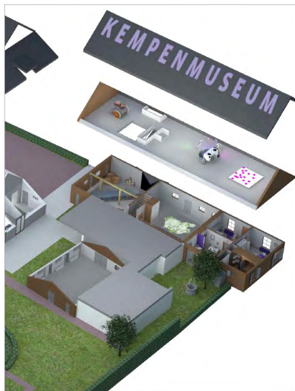
Impressie vernieuwde Kempenmuseum.

In het tweede deel gaven de inleiders een mooi inkijkje in de ‘mogelijke’ toekomst van het Kempenmuseum en de ontwikkeling daarvan. Van een ietwat statisch karakter wil men in de toekomst een bredere geschiedenis gaan vertellen voor een breder publiek en daaraan wordt gewerkt met professionele partners. Bedoeling is ook dat er een bezoekerscentrum komt, los van het museum, gratis toegankelijk voor iedereen die zich op de hoogte wil stellen van natuur en cultuurhistorie van de Kempen.