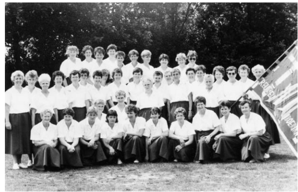
De Reuselse Boerinnenbond in 1960

Vooraf omdat wij van deze vereniging erg weinig fotomateriaal in ons archief hebben zijn we daarmee erg blij en is het een mooie aanvulling van onze collectie.