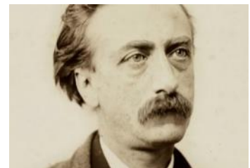
Multatuli (1820-1887) – Auteur Max Havelaar

Deze uitdrukking is afkomstig uit het beroemde boek Max Havelaar, of De koffij-veilingen der Nederlandsche Handel-Maatschappij (1859), geschreven door de onvolprezen Multatuli, het pseudoniem van Eduard Douwes Dekker (1820-1887). In een passage in deze roman komt het motto ‘Hij moet hangen!’ voor.