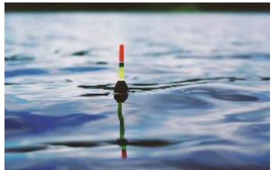
Een dobber, gebruikt tijdens het vissen

Hangt er na een tijdje een stevige vis aan jouw haak, dan wordt de dobber verzwaard en trekt omlaag. Het omhooghalen van de zware vis is dan niet zo gemakkelijk.