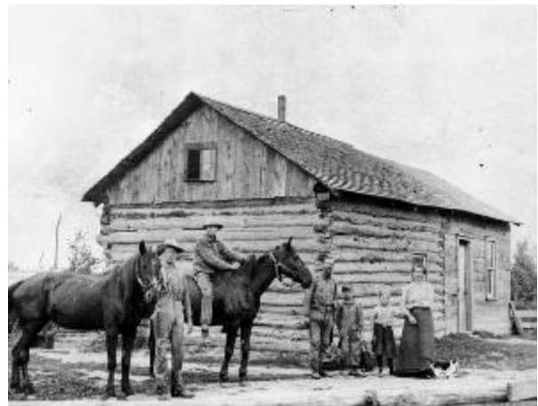
Blokhut van Nederlandse kolonisten in Little Chute rond 1855