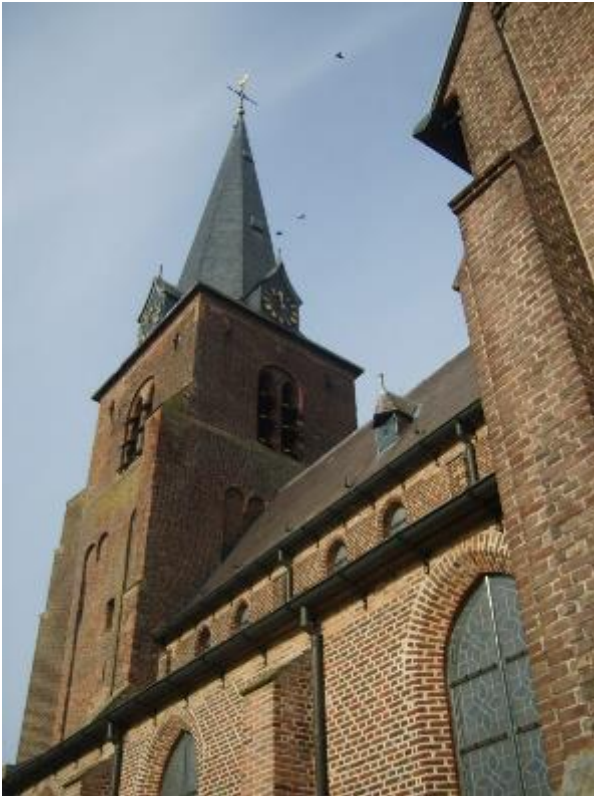
Toren van de Sint Stephanus-Vinding Kerk in Lage Mierde