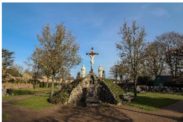
Calvariaberg met priestergraf op de Reuselse begraafplaats

Nederland telt meer dan 4.000 begraafplaatsen, waarvan een groot deel nog in gebruik is, soms al vanaf de middeleeuwen. De grootte varieert van slechts een paar vierkante meter tot meer dan 30 hectare. Bijna een kwart is rijksmonument of gemeentelijk monument.