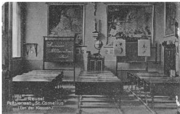
Klaslokaal van de school in Reusel

Te Reusel, eene gemeente in Noord-Brabant van 1000 inwoners, is de openbare school geheel o n t v o l k t en worden thans pogingen aangewend om die school op te heffen. Zes jaren geleden werd door het kerkbestuur eene bijzondere meisjesschool opgericht, en zonder eenige uitzondering verlieten toen alle meisjes de openbare school. In 1884 werd eene school geopend van geestelijke broeders, die al zeer spoedig alle jongens der openbare school opnam.