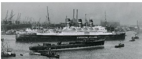
De Statendam van de Holland-Amerika Lijn op de Nieuwe Maas te Rotterdam, 11 juni 1929.

Ben je op zoek naar familieleden die in de 20ste eeuw een tijdje in de Verenigde Staten of Canada verbleven of daarheen emigreerden, dan vormen de passagierslijsten van de Holland-Amerika Lijn een prachtige bron.