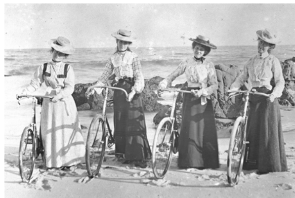
Vrouwen met fietsen in Australië, ca. 1900.

In 1890 verschijnt er een veiliger alternatief voor de fiets met het grote voorwiel: de zogenoemde safety bicycle , waarbij beide wielen even groot zijn. Het ontwerp vormt de basis voor de fiets zoals we die vandaag de dag kennen. Het rijwiel heeft voor het eerst pedalen op een trapas die het achterwiel aandrijven met een ketting.