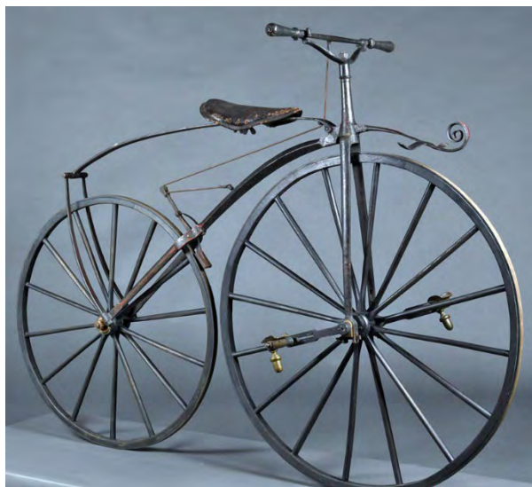
Vélocipède van Michaux.

De eerste fiets met trappers verschijnt rond 1860 en wordt gemaakt door Ernest Michaux. Omdat men zich steeds sneller wil voortbewegen, maakt Michaux het voorwiel groter. Met elke omwenteling van de trappers leg je zo meer afstand af, waardoor hogere snelheden mogelijk zijn. Eerst maakt men de fiets van hout, maar later van ijzer. Vooral rijke burgers rijden op deze eerste trapfietsen. Hoewel het apparaat een groot succes is, kleven er ook een paar nadelen aan. Zo weegt het metalen frame maar liefst 50 kilo. Rijden op de fiets is daardoor geen pretje: door de harde wielen voel je elke hobbel in de weg. De fiets krijgt dan ook de bijnaam 'boneshaker' (bottenschudder).