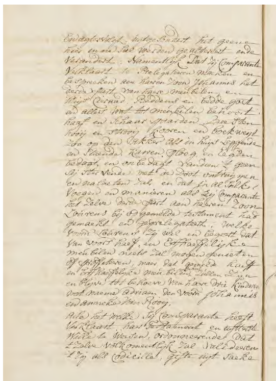
Een testament uit 1720.