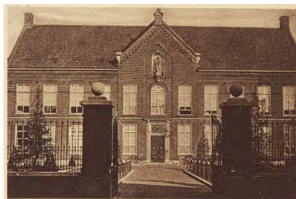
Tilburg - Sint Elisabeth Gasthuis.

Het Regionaal Archief Tilburg heeft een nieuwe bron toegevoegd aan zijn genealogische database: de ziekenregisters van het Sint Elisabeth Ziekenhuis en zijn voorloper, het Sint Elisabeth Gasthuis.