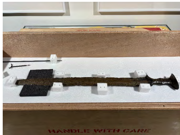
De ijzeren lanspunt in een speciale transportkist.

Cultuurhuis Bergeijk gebracht. Hieronder een zwaard, twee urnen van De Galgenberg en een gerestaureerde ijzeren lanspunt uit het Merovingische grafveld aan de Fazantlaan. De bronstijd objecten waren afgelopen maanden geëxposeerd op de indrukwekkende tentoonstelling Bronstijd – Vuur van verandering van het RMO in Leiden. Inmiddels liggen alle objecten weer prachtig te 'schijnen' in de vitrines voor de bezoekers in Bergeijk.